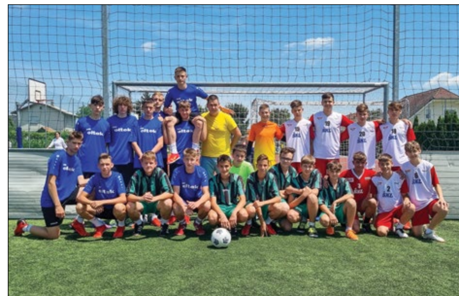
Osmo- in devetošolci OŠ Hajdina in OŠ Destrnik - Trnovska vas