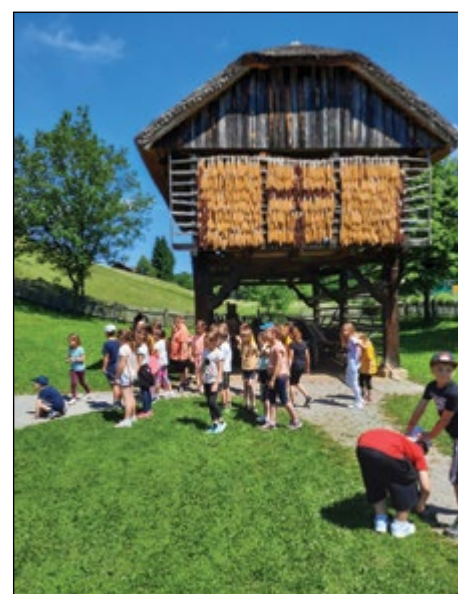
Drugošolci so obiskali Rogatec.