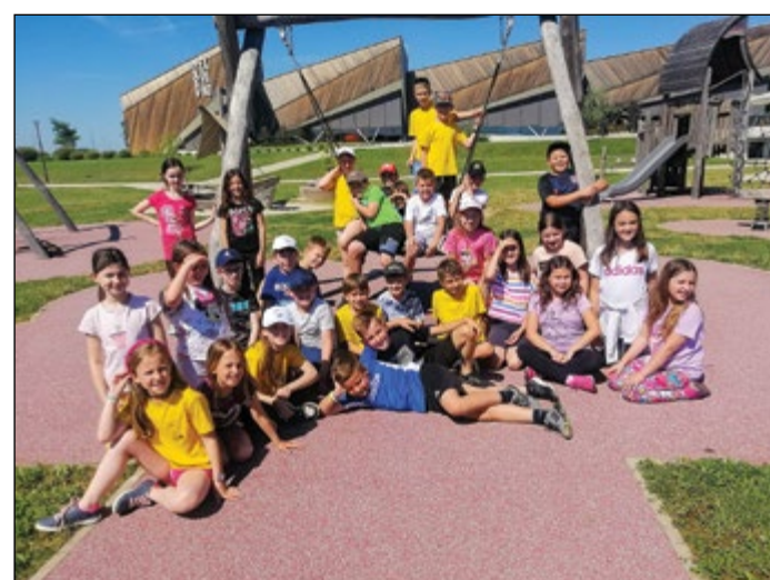
Tretješolci so se potepali po Prekmurju.