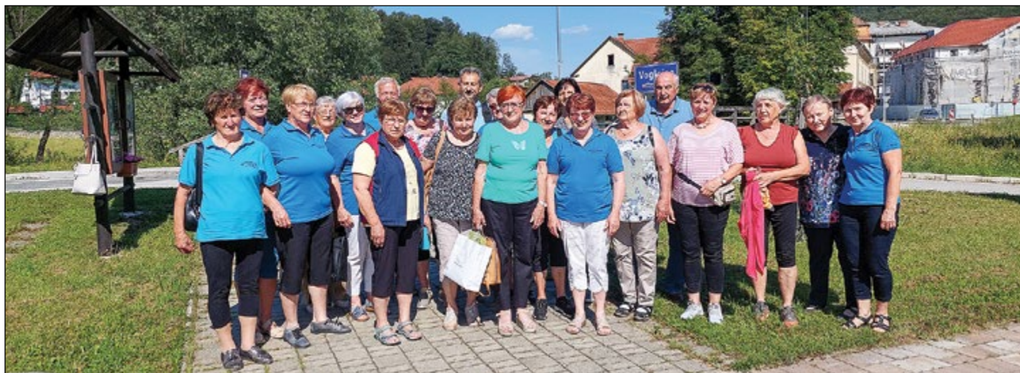
Naj prvič ne bo poslednjič – vsi na spominskem posnetku so se strinjali, da bo naslednje delovno srečanje na Hajdini.