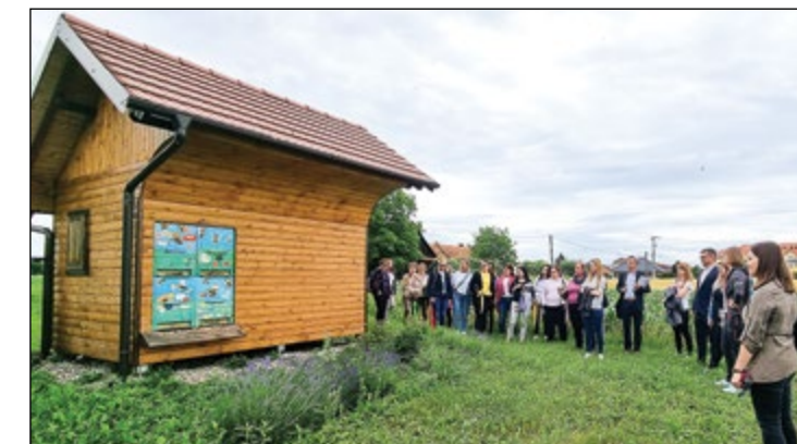
Ogled učilnice na prostem in čebelnjaka