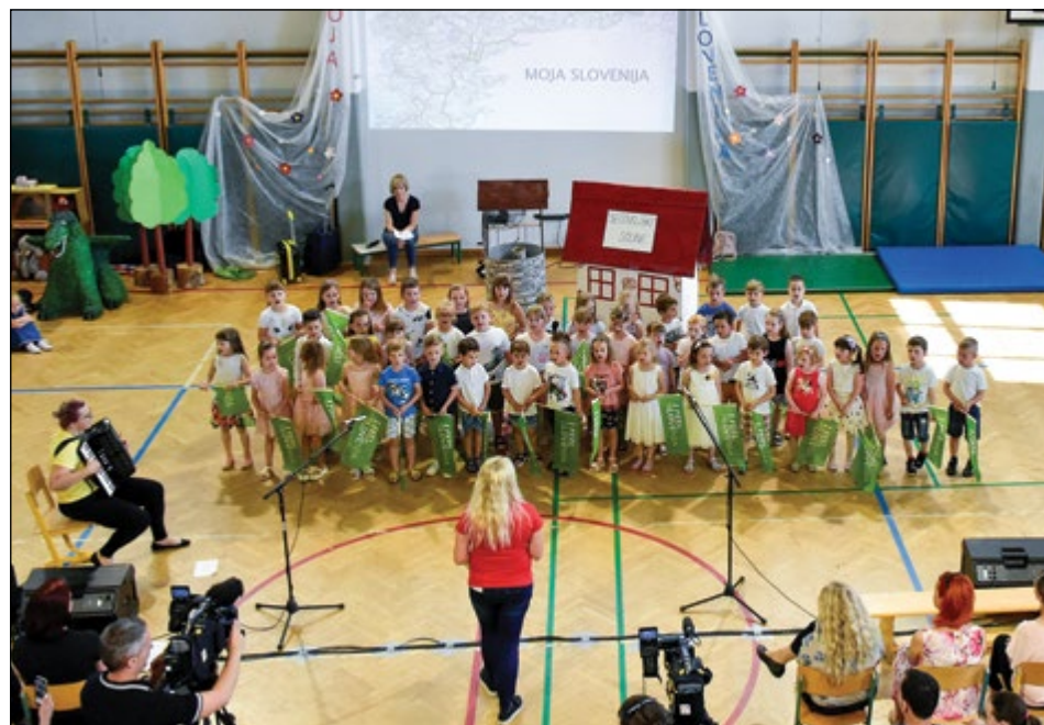
Otroci v zborčku Mavrica raja so predstavili himno vrtca.