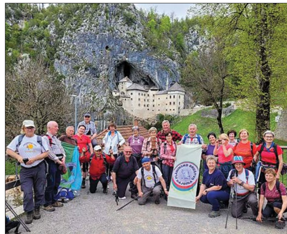
Fotografiji sta nastali na Jakobovi poti iz Ljubljane do Trsta. Hajdinski planinci pred Predjamskim gradom v kraju Predjama.