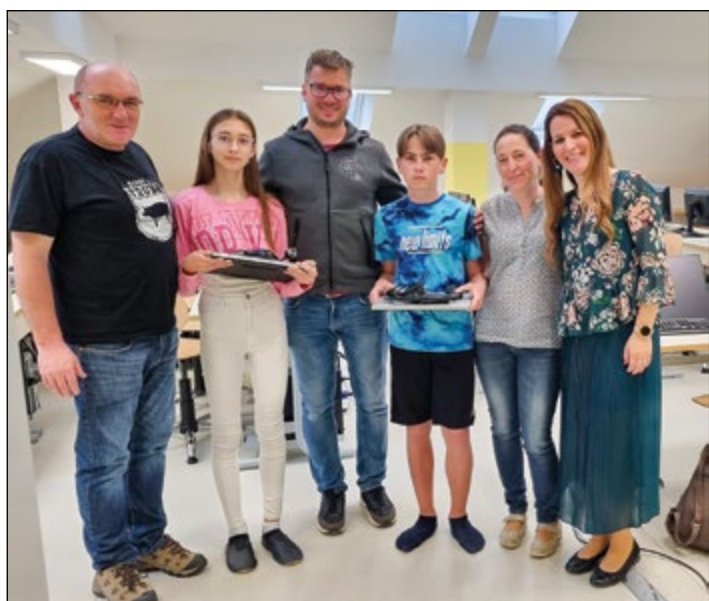
Donacija računalnikov za učence iz Ukrajine