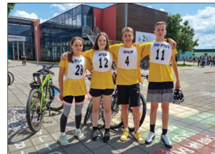
Ekipo OŠ Hajdina na prometnem tekmovanju

Besedilo in foto: Janja Bratuša, vodja Prometne varnosti