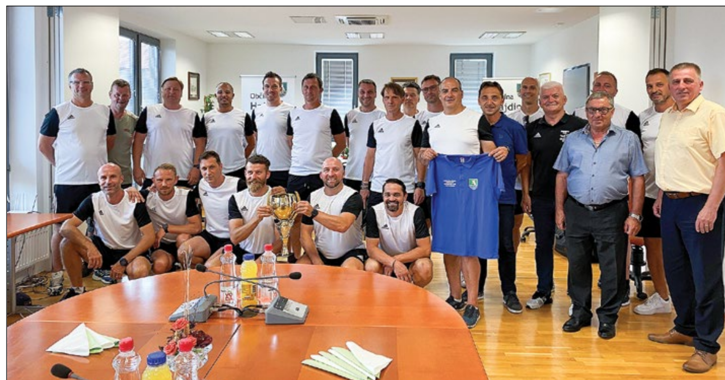
Sprejem veteranov NK Skorba pri županu