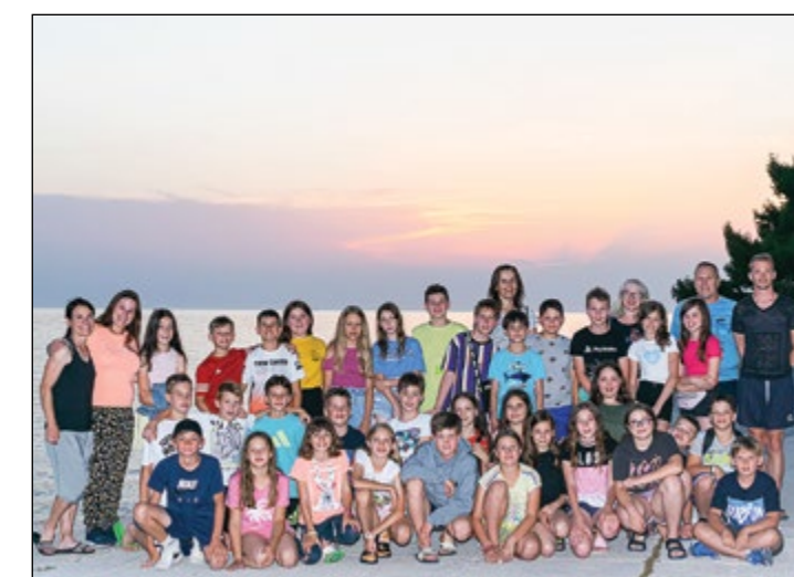
Petošolci pred sončnim zahodom na portoroški plaži skupaj z razredničarkama in učitelji spremljevalci