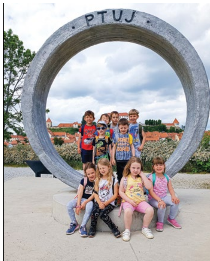
Skupaj v ptujskem prstanu

A kaj, ko so se nam očke ob prijetnem branju pravljice kar same od sebe zaprle. Zdi se mi, da sem za lahko noč dobil poljubček na lica, a sem že sanjal o tem lepem dnevu. Zjutraj so nasmejani otroci odhiteli v umivalnico, poskrbeli za jutranjo nego in se ponovno zbrali ob jutranjem obroku.