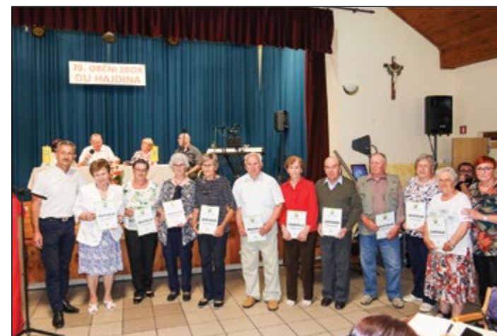
Zahvale za 30 let članstva