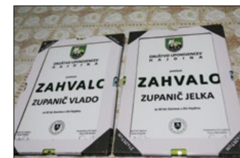
Še dokaz o dolžini članstva ...