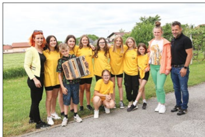
Učenci OŠ Hajdina z mentorjema na 70-letnici DU Hajdina