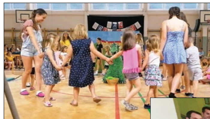
Otroci rumene igralnice smo se ob koncu šolskega leta povezali z dekleti 7. razreda in se predstavili s plesno točko Ljubljanski zmaj.