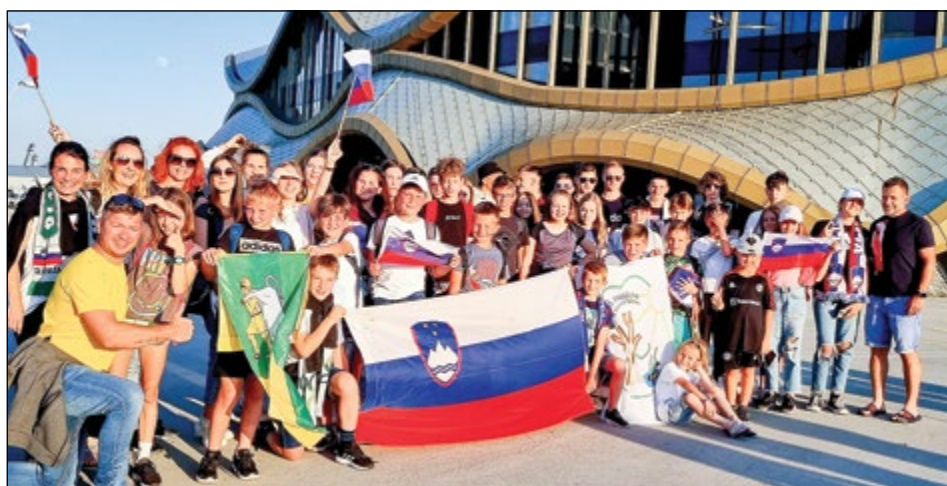
Uspešni športniki na ogledu nogometne tekme v Stožicah. Hvala županu za podarjene vstopnice.