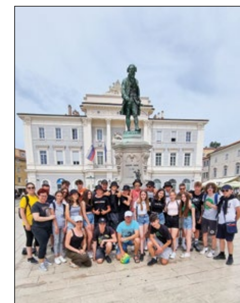
Devetošolci sredi Tartinijevega trga v Piranu