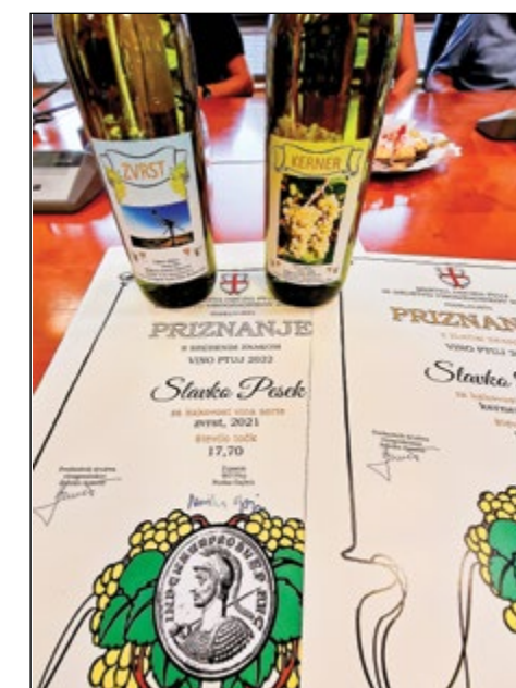
Čestitka za osvojene nagrade ...