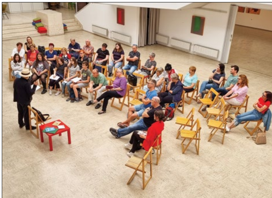
Utrinek z zaključnega srečanja v Murski Soboti

Naslednje medgeneracijsko druženje je potekalo ob stripu Živalska kmetija Andreja Rozmana Roze . Strip je avtor povzel po romanu Georga Orwella Živalska farma , a je zgodbo umestil v naš čas in prostor. Ob branju smo se neizmerno zabavali; vsi smo se strinjali z ugotovitvijo avtorja, da je ži-