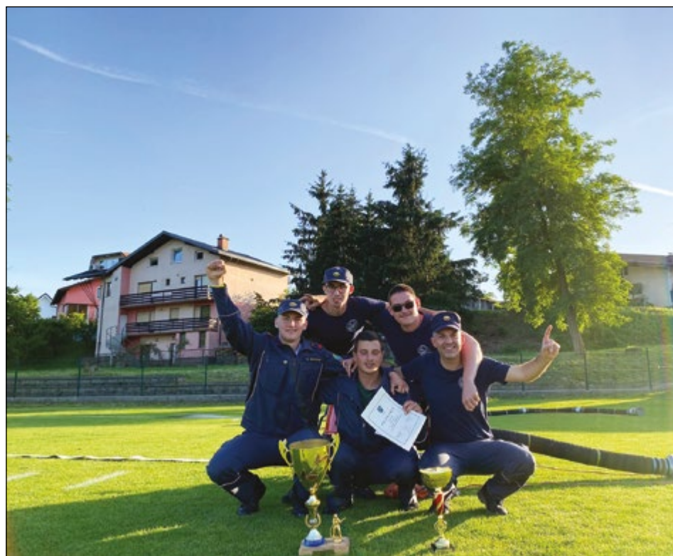
Prve zmage so se veselili člani A PGD Hajdoše.