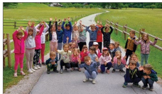
Predšolski otroci v osrčju prelepe Logarske doline

Takoj ko so se pred vrtcem poslovili od svojih staršev, ki niso skrivali žalostnih obrazov, in se podali na avtobus, se je dogodivščina tridnevnega potovanja začela. Na obrazih otrok so sijale iskricice v očeh.