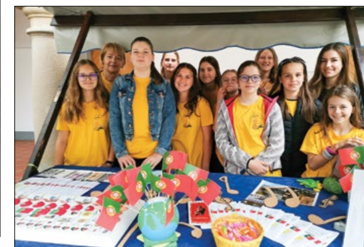
V sklopu projekta Države EU je v maju naša šola predstavljala Portugalsko.