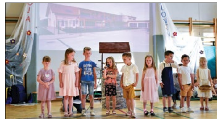
Prireditev so vodili otroci bele in rdeče igralnice.