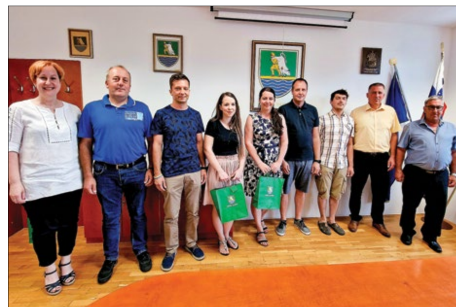
Nagrajenci na Vino Ptuj 2022 in Festivalu Dobrote slovenskih kmetij na sprejemu v prostorih občine Hajdina, kjer jim je za dosežek čestital župan občine Hajdina.