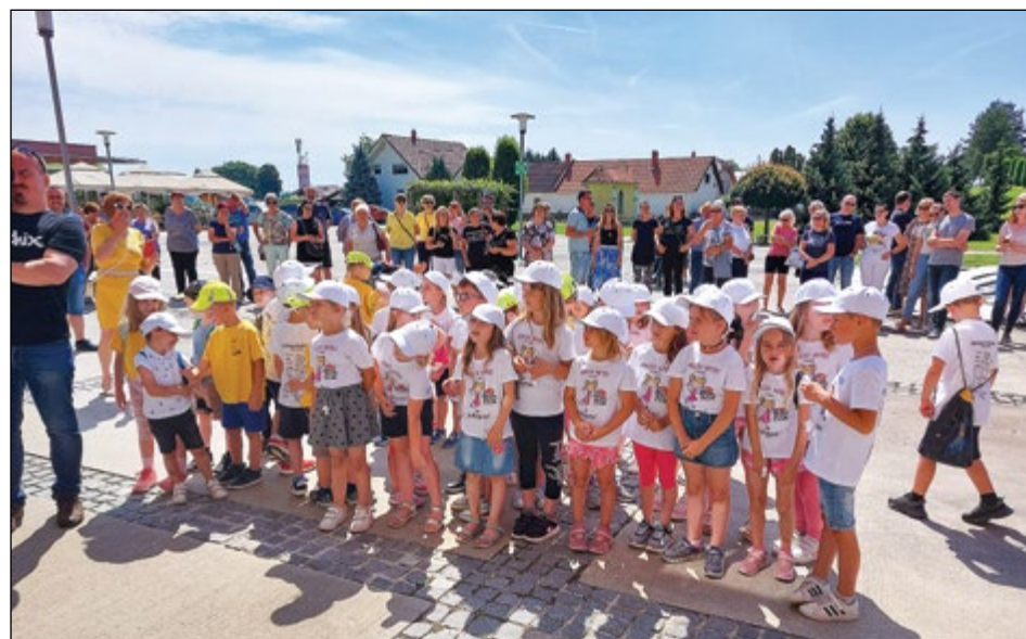
Zbrani minimaturanti na občinskem trgu