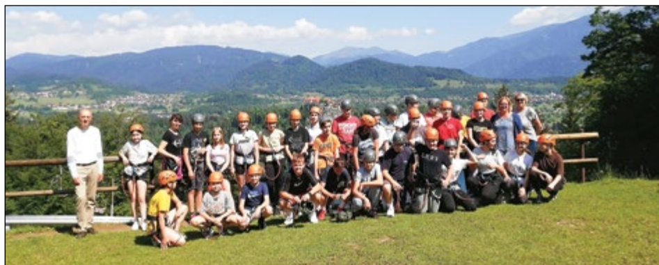
»Jaz pa pojdem na Gorenjsko,« so si prepevali osmošolci.