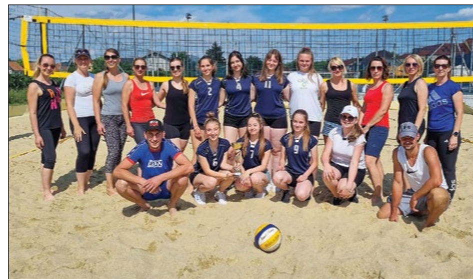
Ženska odbojarska ekipa