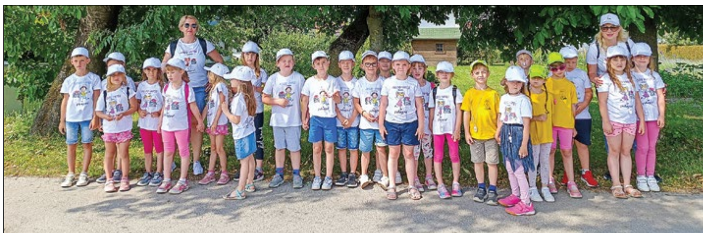
Za nas se igra je končala, hej, hej, hej ...