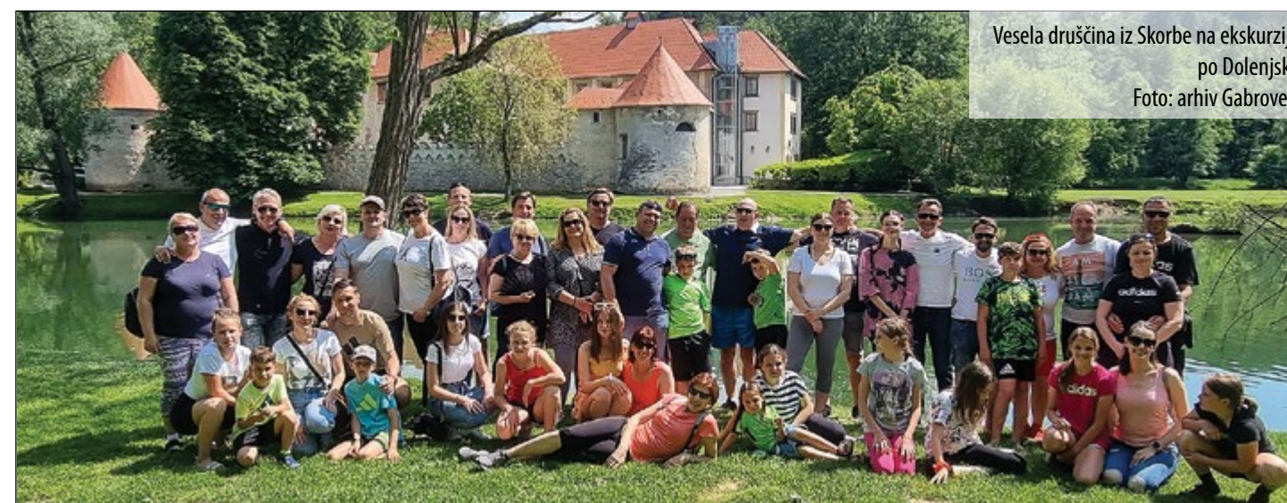
Vesela družina iz Skorbe na ekskurziji po Dolenjski