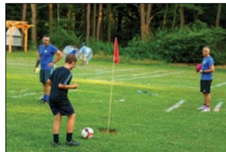
V sklopu poletne šole nogometa še footgolf