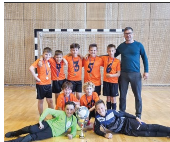
Srebrni najmlajši nogometaši na medobčinskem prvenstvu v nogometu