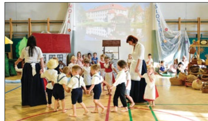
Otroci zelene igralnice so se prelevili v Ribničane.