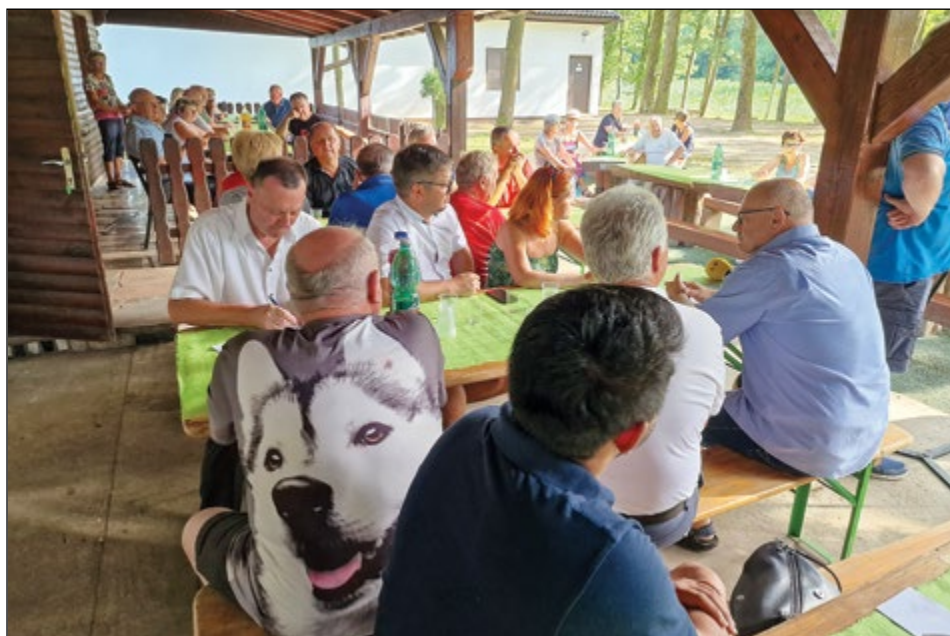
Utrinki z delovnega srečanja hajdinskih planincev