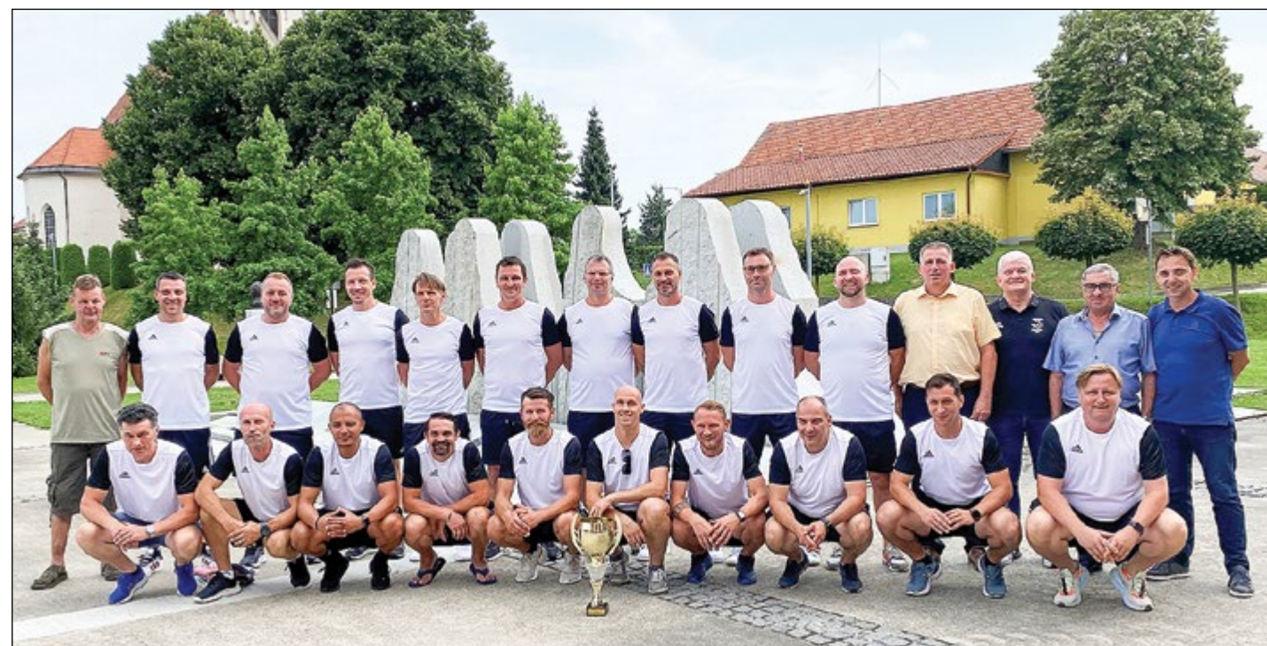
Skupinska fotografija ekipe veteranov NK Skorba