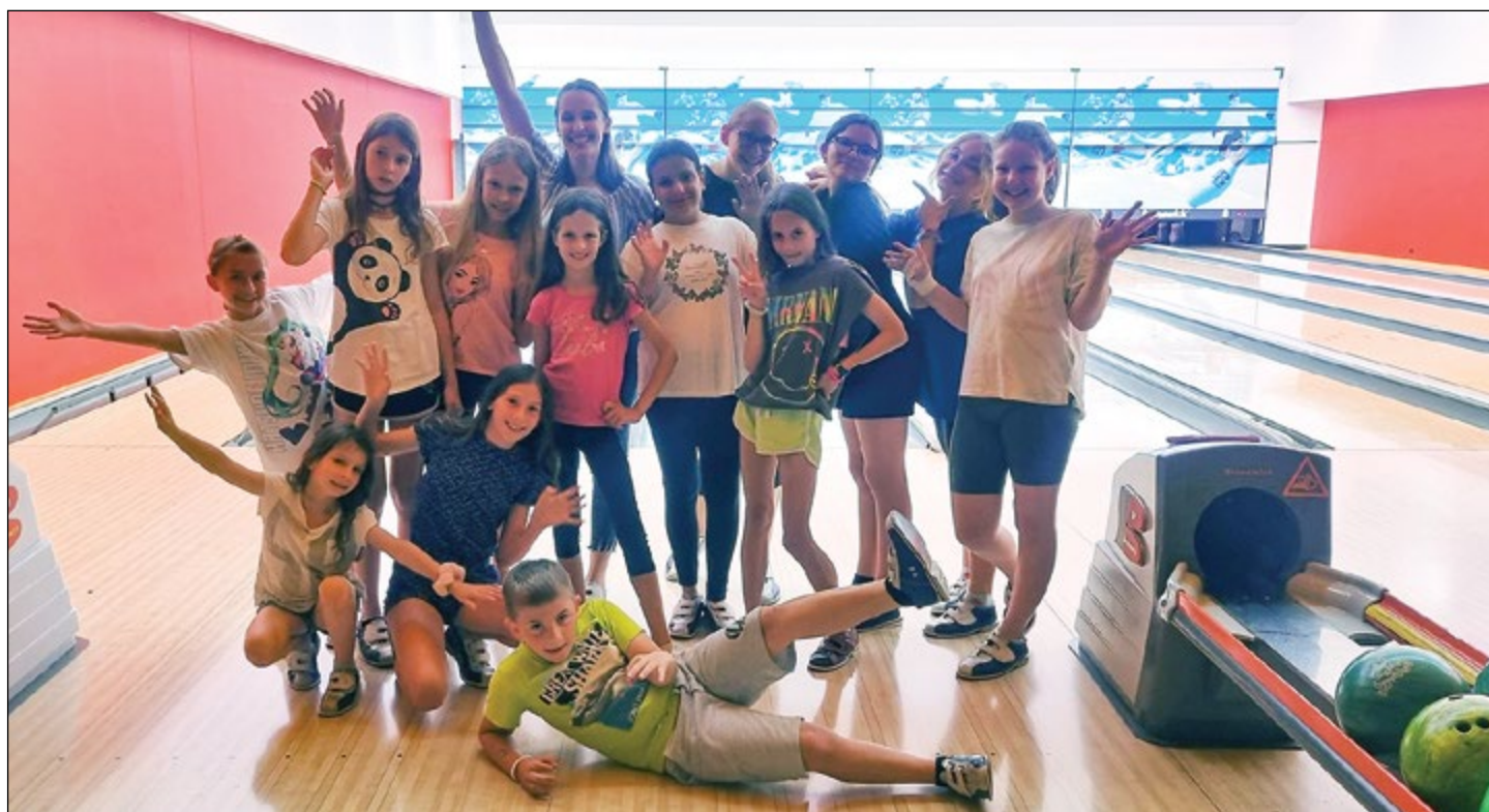
Mladi gledališčniki so se pred poletnimi počitnicami družili na bowlingu.