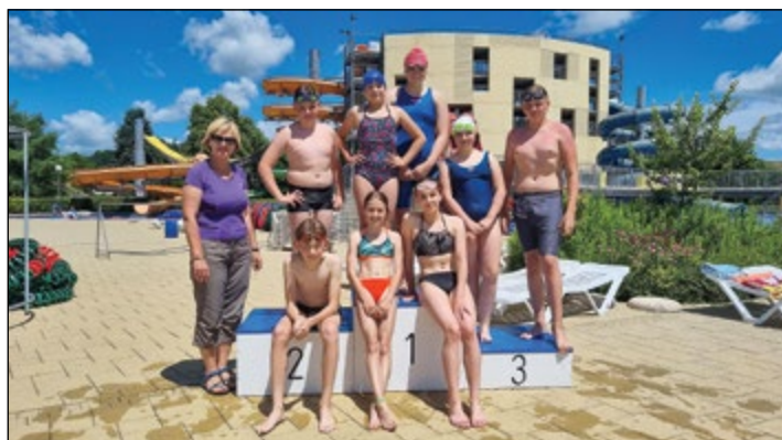
Ekipa, ki je na področnem plavalnem prvenstvu osvojila 14 medalj.