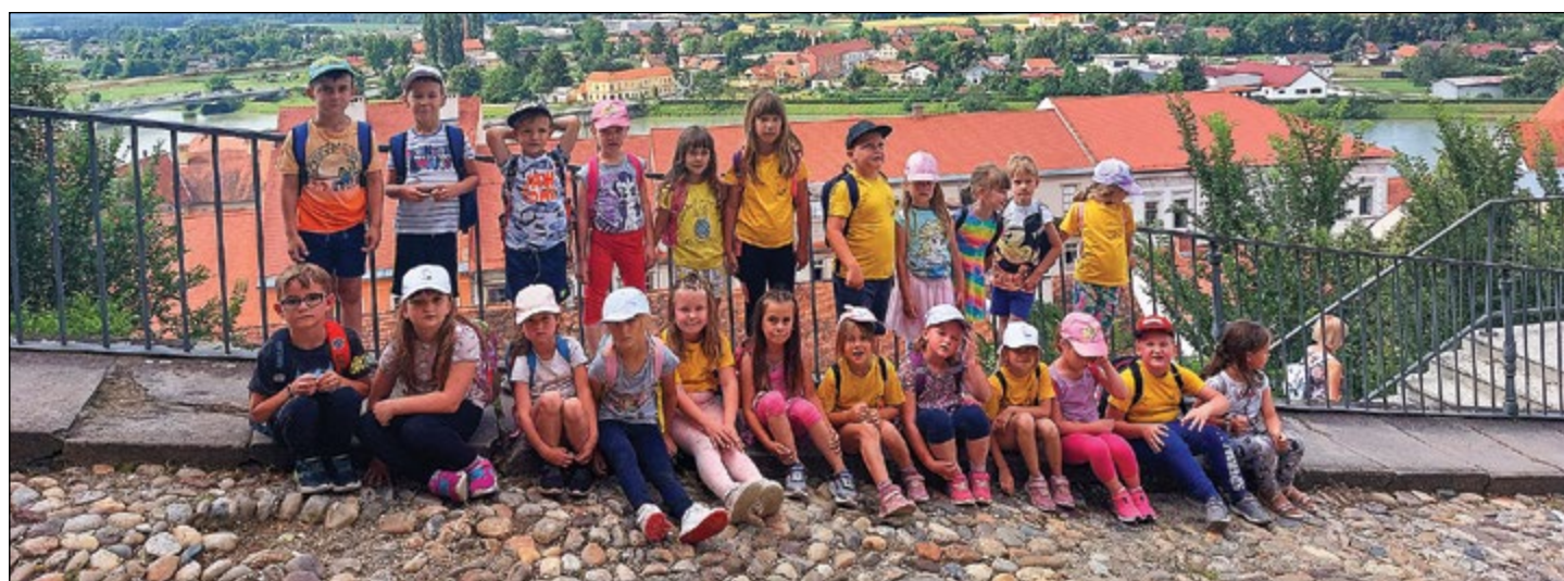
S Ptujkega gradu vam lepe pozdrave pošiljajo otroci iz rdeče igralnice.