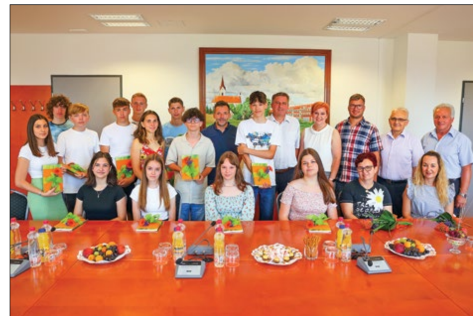
Odličnjaki v družbi razrednikov in obeh ravnateljev na sprejemu v občini Hajdina. Čestitamo!