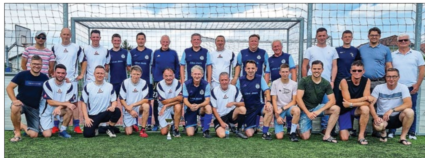
Nogometaši z največ izkušnjami