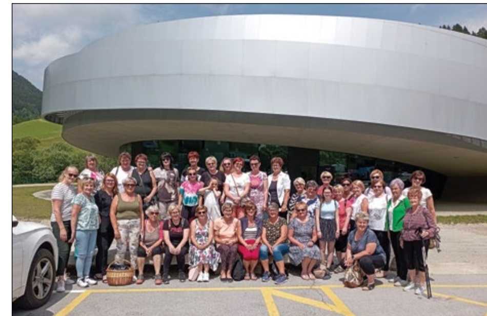
Draženčanke so se tokrat podale do hribovskih kmetij, do Vitanja, kjer so si lahko ogledale Noordung center Vitanje, kjer promovirajo vesoljsko tehnologijo in človeške dosežke v vesolju. Na binkoštni so bile še pri sveti maši v cerkvi Marije Vnebovzete na Hriberci.