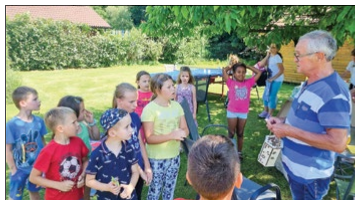
Zaključek čebelarkega krožka