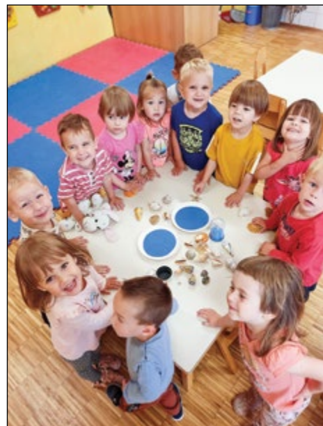
Otroci vijolične igralnice med raziskovanjem morskikh školjk