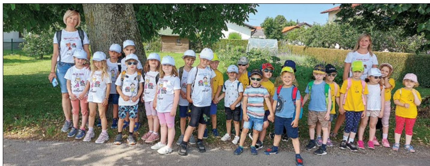
Šola nam bo delo dala, hej, hej, hej ...