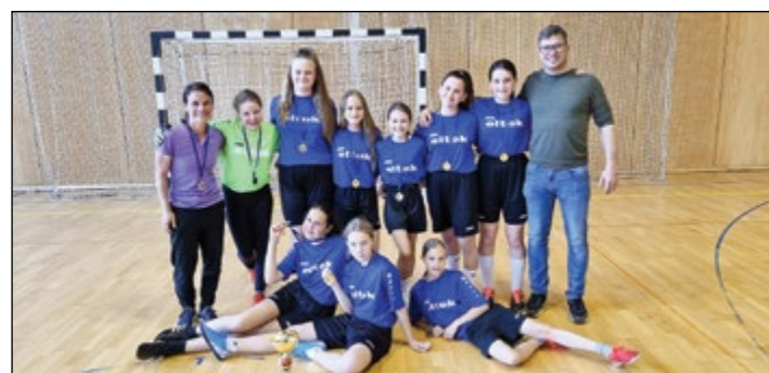
Mlajše deklice – medobčinske prvakinja v nogometu