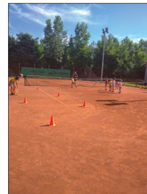
Utrinek s teniških igrišč

Skupinski posnetek udeležencev Poletne šole tenisa, ki je potekala na igriščih Goja centra v Hajdošah. Tenis klub Skorba vabi vse mlade nadobudneže, da se priključijo njihovim aktivnostim, ki so tudi povezane s šolo tenisa za mlade. Obenem tudi