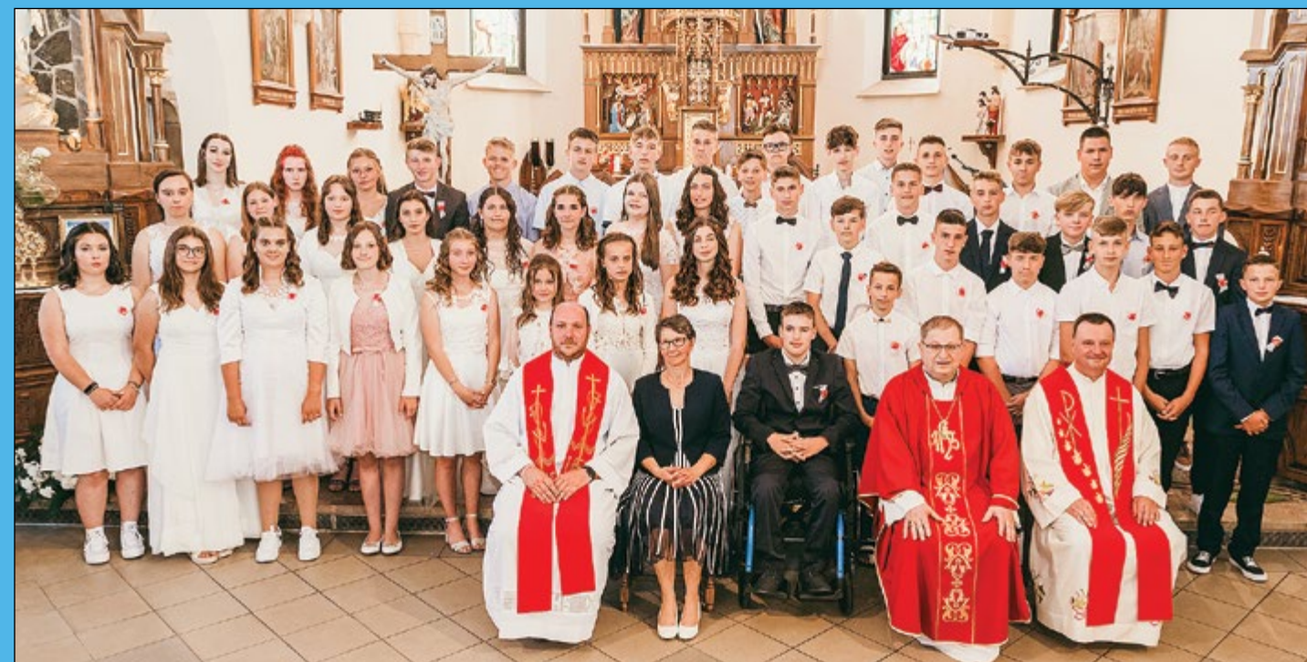
Letošnji birmanci in birmanke v hajdinski župniji.