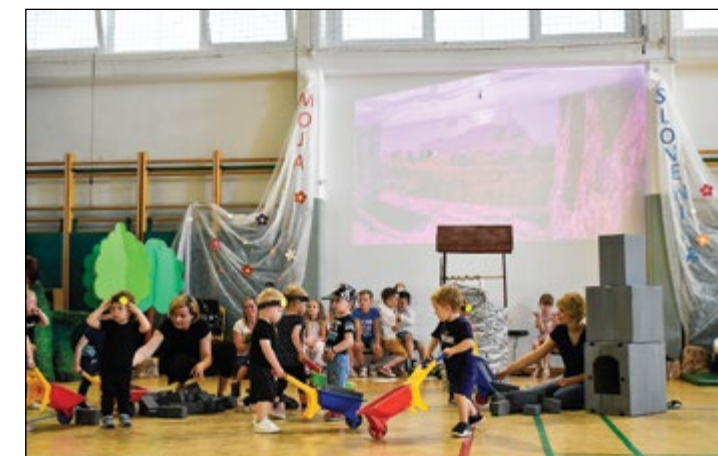
Globoko v podzemlje so nas odpeljali rudarji iz oranžne igralnice.