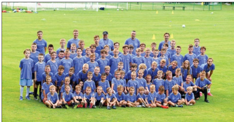
Skupinski posnetek udeležencev Poletne šole nogometa 2022 v občini Hajdina

Športna zveza Občine Hajdina in Otroška nogometna šola Golgeter Hajdina sta tudi letos organizirali Poletno šolo nogometa za otroke, stare od 5 do 13 let, in sicer v terminu od 27. junija do 1. julija, tradicionalno v Športnem parku ŠD Gerečja vas.