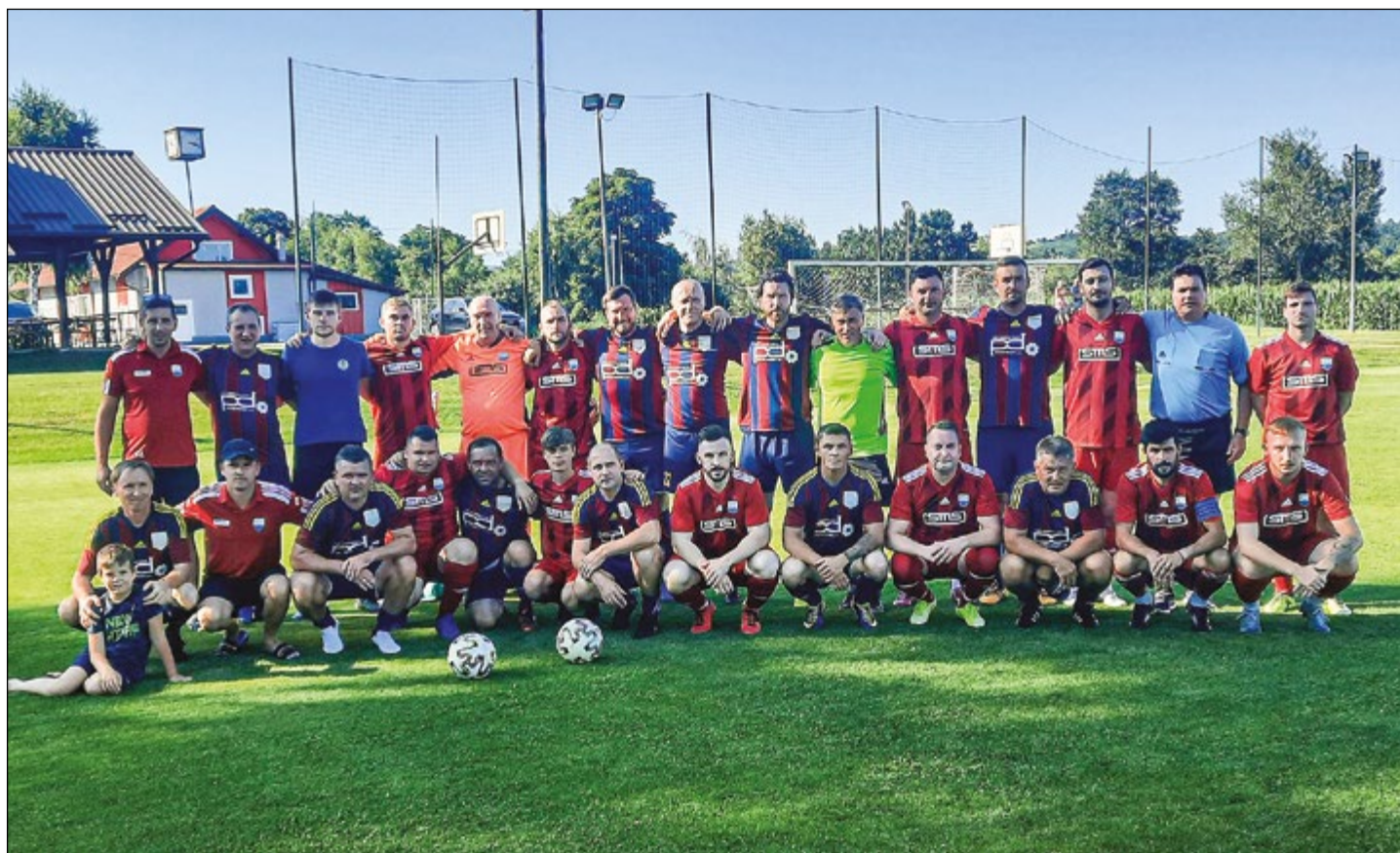
Članska in veteranska ekipa iz Slovenje vasi sta odigrali prijateljsko tekmo, kljub temu pa je bil rezultatski naboj iz obeh strani močno prisoten.