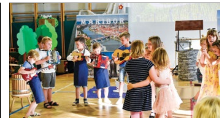
Domačo Štajersko so predstavili otroci rdeče igralnice.