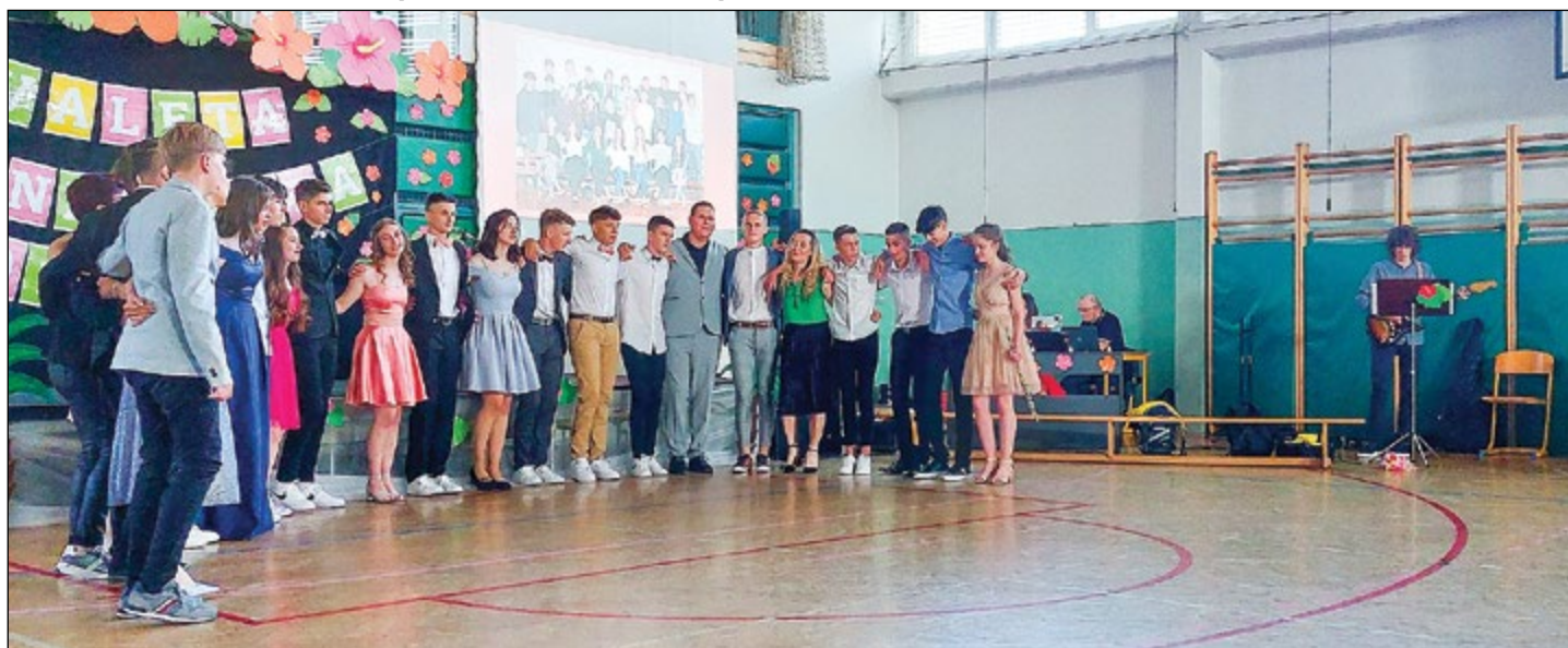
Utrinek z letošnje hajdinske valeta.

Letos je osnovno šolo na Hajdini uspešno končala generacija 2013–2022. Osnovna tematika valeta so bili Havaji, kjer raste tudi ananas. Ima veliko pomembnih sestavin in pozitivnih učinkov.