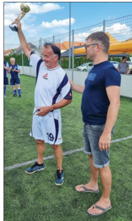
Pokal med starejšimi igralci so osvojili športni pedagogi Spodnjega Podravja.

Besedilo in foto: Mitja Vidovič, ravnatelj