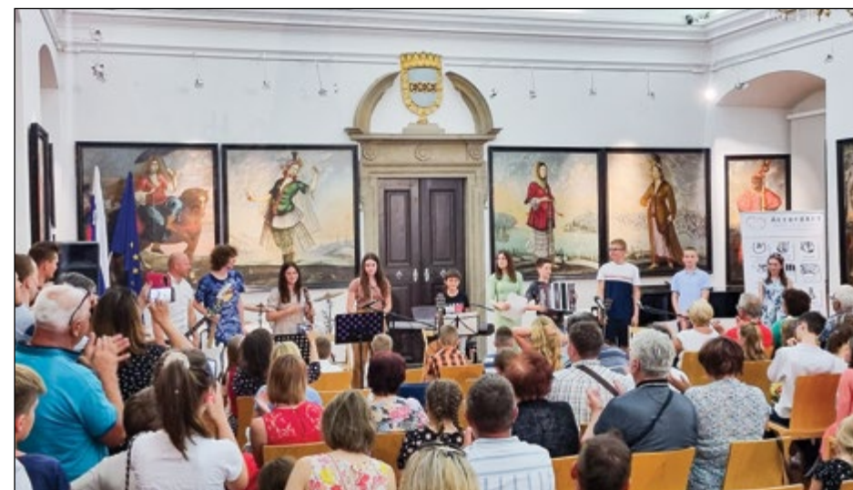
Šolski orkester na koncertu na Ptujskem gradu