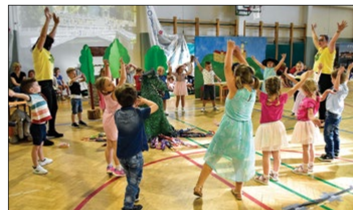
V belo Ljubljano so se podali otroci rumene igralnice.