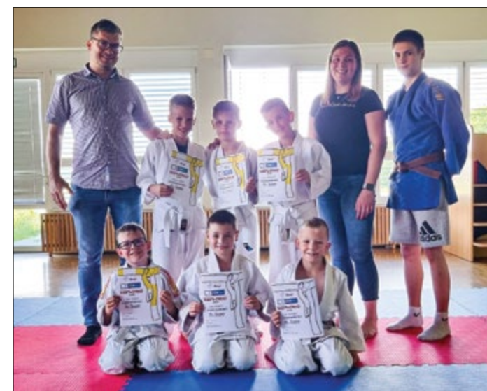
Naši judoisti so položili belo-rumeni pas.