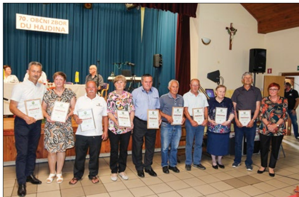
Prejemniki priznanj DU Hajdina za večletno aktivno delovanje na različnih področjih v okviru DU Hajdina