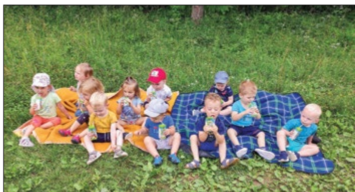
Otroci in vzgojiteljci iz oranžne igralnice so se odpravili na izlet do gozdne jase, kjer so se posladkali s sladoledom in zelo uživali.