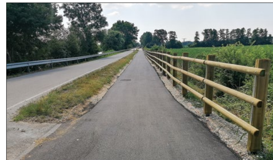
Del dravske kolesarske poti v naselju Slovenja vas, ki je bila v slabem stanju, je že obnovljen.

Lokalna cesta na Zg. Hajdini, od gasilskega doma proti naselju preko proge, je že dlje časa v zelo slabem stanju. Zdaj je dokončno znano, da bo cesta modernizirana po odprtju obvoznice za Kidričevo.