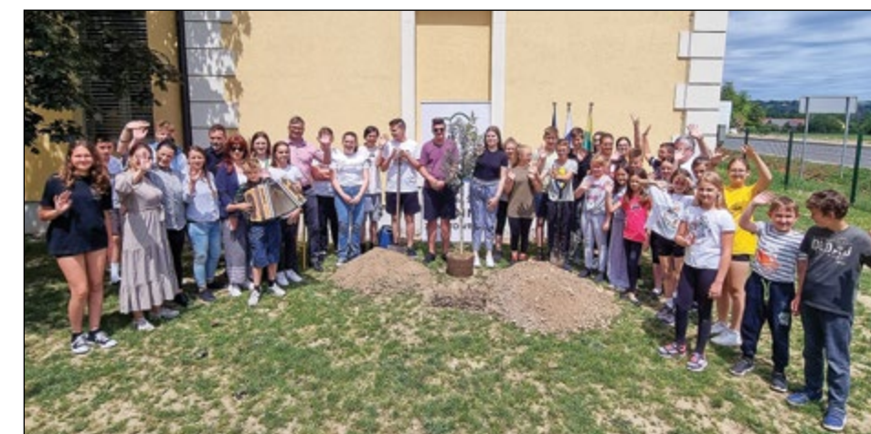
Kot simbol prijateljstva so nam učitelji in učenci iz OŠ Vis podarili oljko, ki smo jo skupaj slavnostno posadili.

Omenjeni dveletni projekt (tudi del učnega načrta) poteka od začetka šolskega leta 2021/22, končal pa se bo februarja 2023. Njegova glavna poudarka sta učenje na prostem in skrb za okolje. Učenci s pomočjo različnih aktivnosti bolje razumejo, kako lahko njihova dejanja in dejanja drugih vplivajo na okolje tako lokalno kot tudi globalno, spoznavajo lastno kulturo in kulture sodelujočih držav, spo-