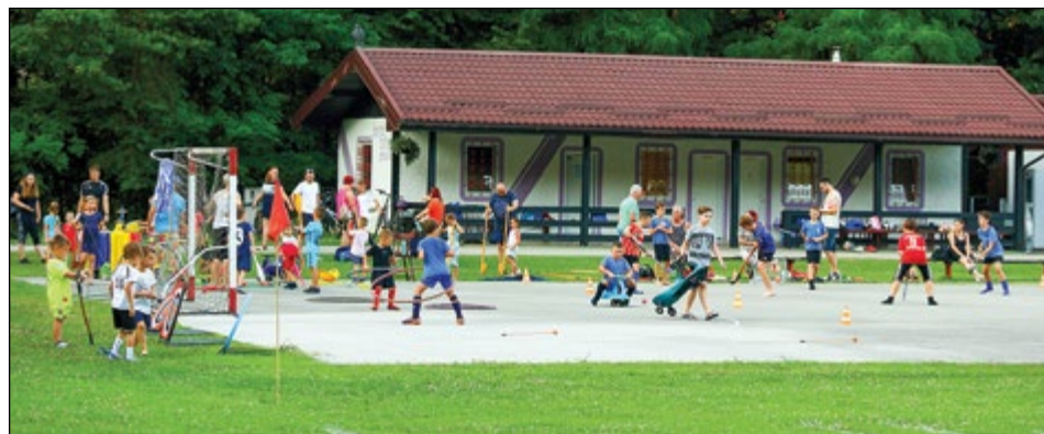
Animacija bratov Malek je počitnikarje zelo pritegnila.