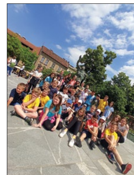
Tudi četrtošolci so zavzeli ljubljanske ulice in spoznali naše glavno mesto.