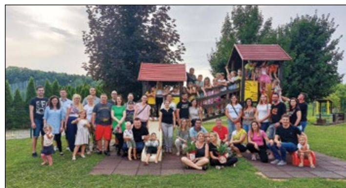
Zaključno druženje staršev, otrok in vzgojiteljic rdeče igralnice