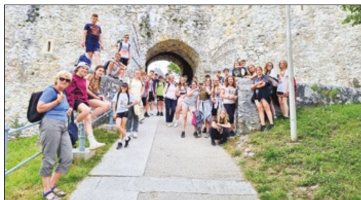
Sedmošolci pred vhodom v Celjski grad