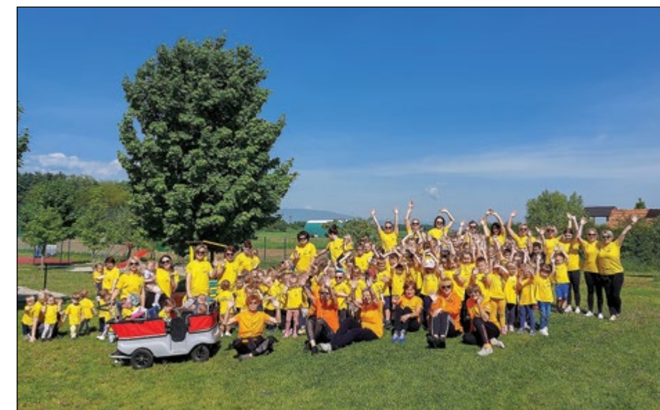
Medgeneracijsko druženje ob telovadbi