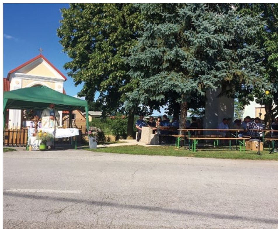
Tradicionalni prizori iz naše preteklosti – zbiranje pod vaško lipo, druženje, klepet ...