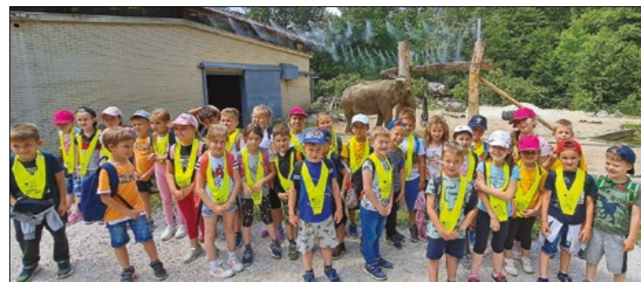
Najmlajši, prvošolci, so obiskali majhne in velike živali v Živalskem vrtu Ljubljana.