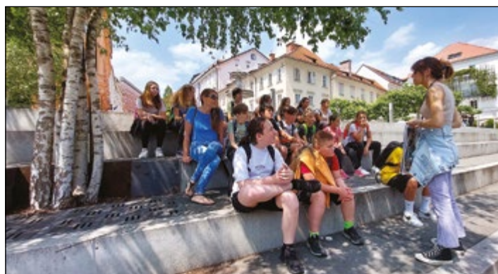
Šestošolci med poučnim raziskovanjem prestolnice