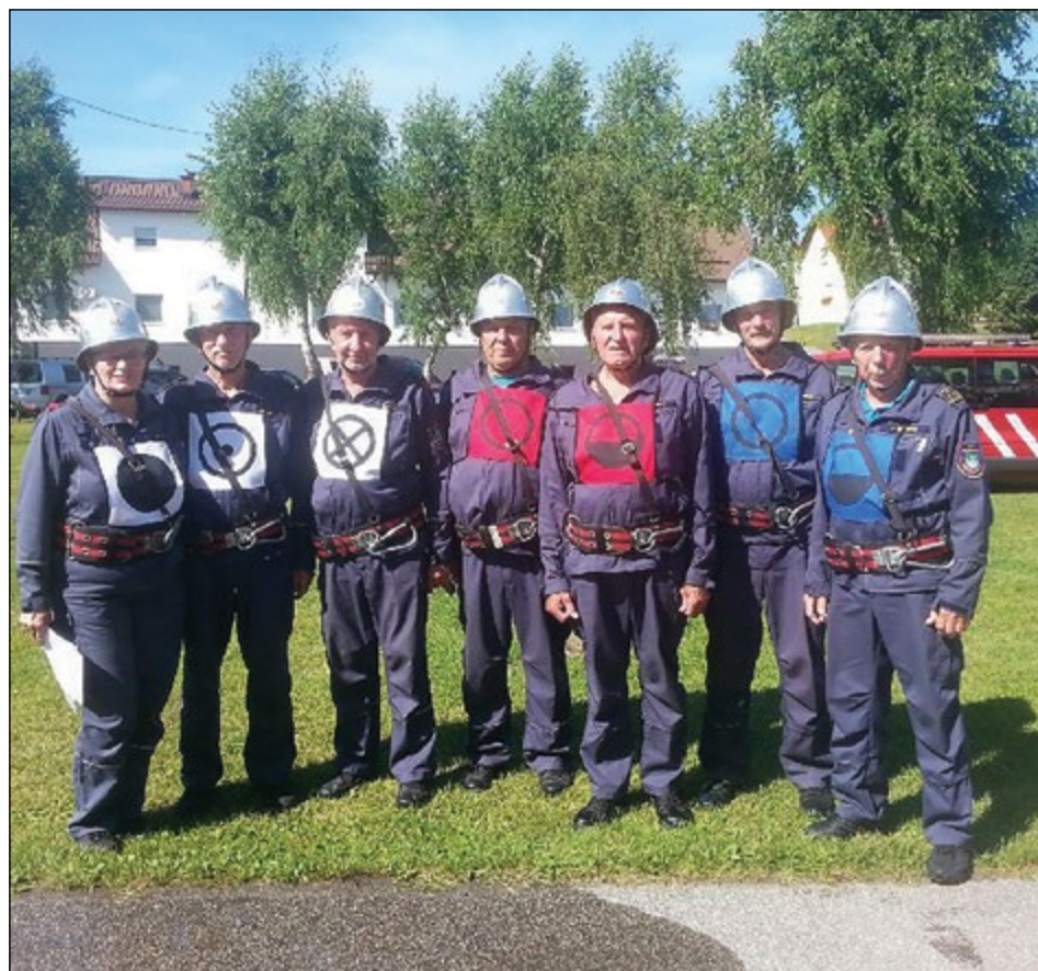
Na domačem terenu je tekmovala tudi ekipa starejših gasilcev PGD Slovenja vas.