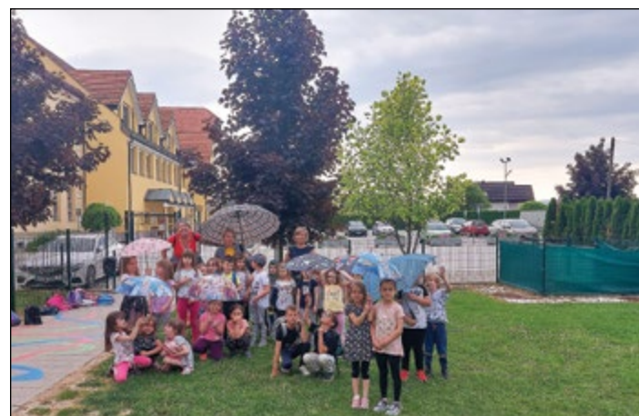
Zbrani pod dežniki

Vsak od nas je imel ob svoji posteljici čisto svojo lučko in prijatelja tako na levi kot na desni strani. O, zdaj bo pa žur.