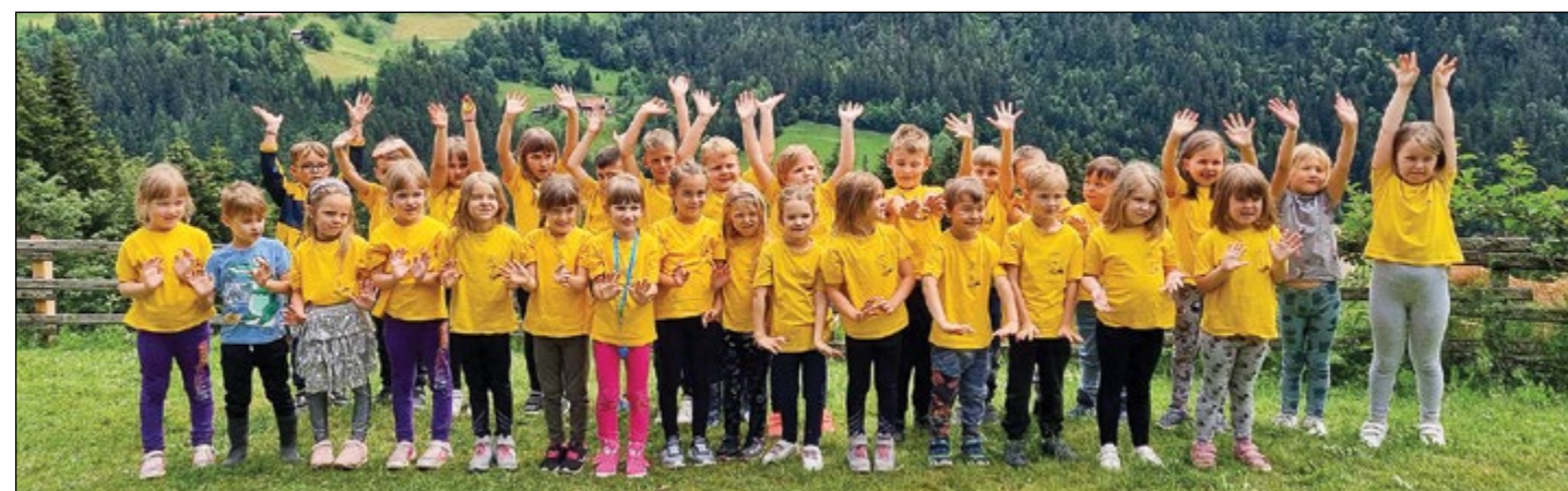
Skupna fotografija otrok bele in rdeče igralnice, ki so se udeležili tabora.