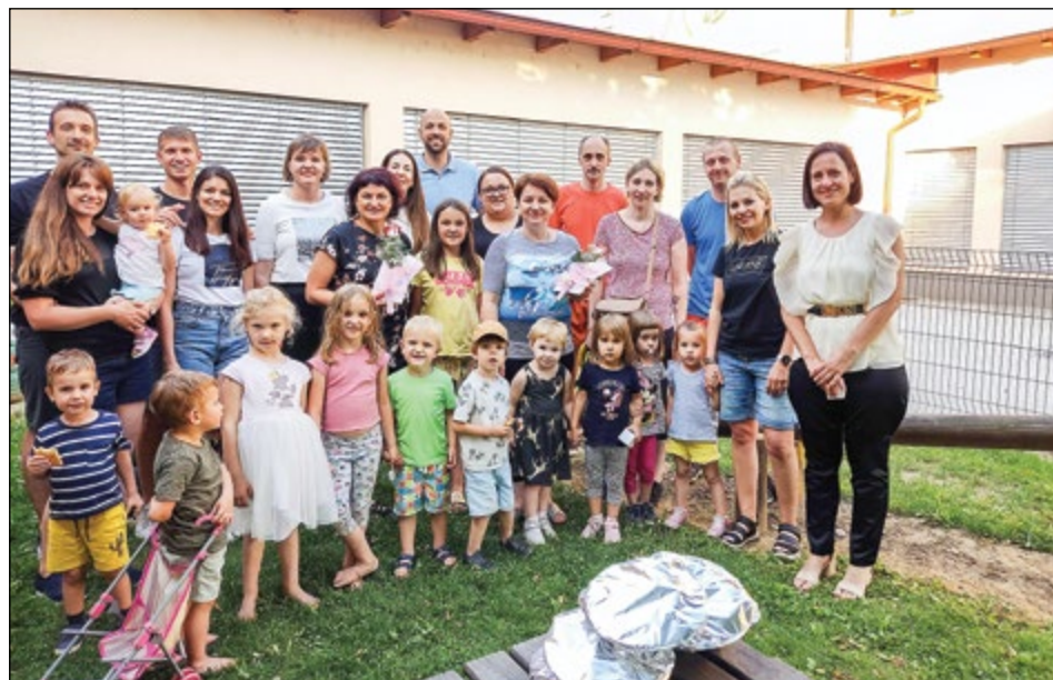
Prijetno druženje staršev in otrok vijolične igralnice na zaključnem srečanju