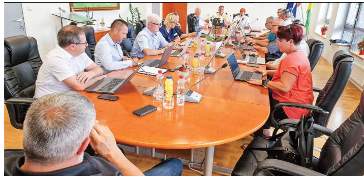
Hajdinski občinski svet se je v juniju sestel na dveh rednih sejah.