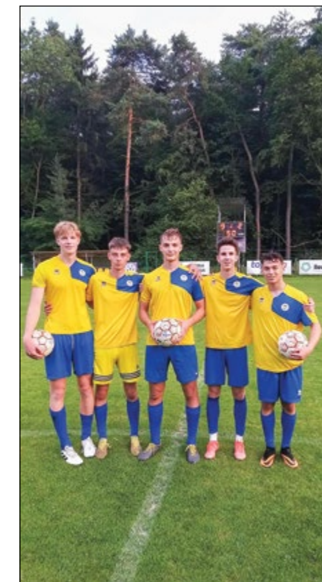
Ekipa U19 na zaključku sezone

Uspešno smo torej končali zgodbo številka 15, prihajajo pa že novi obrazi, oblikujejo se že nove generacije igralcev in z veseljem zremo v hajdinsko nogometno prihodnost. Ob koncu še enkrat hvala vsem, ki podpirate našo uspešno zgodbo, od Občine Hajdina in župana do trenerjev in ne nazadnje do vseh staršev in otrok, zaradi katerih vse to počnemo. Naj se na koncu še enkrat zahvalimo generaciji letnikov 2003, ki se je