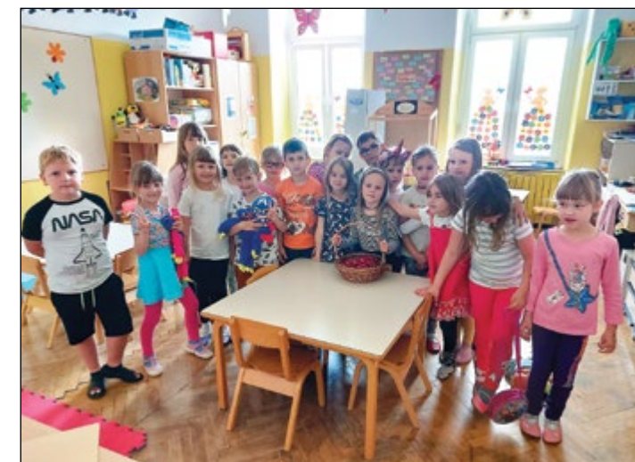
Rdeče češnje rada jem ... Tako so si zapeli in se posladkali s slastnimi češnjami otroci rdeče igralnice.