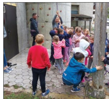
Otroci so se skupaj z ravnateljem preizkusili v plezanju.

Že tradicionalno so tudi letos predšolski otroci rdeče in bele igralnice vrtca Najdihojca Hajdina obiskali Logarsko dolino. Otroci se na tabor pripravljajo in veselijo skozi vse leto, saj je to zanje pomembna, a hkrati vznemirjajoča dogodivščina na njihovi vrtčevski poti.