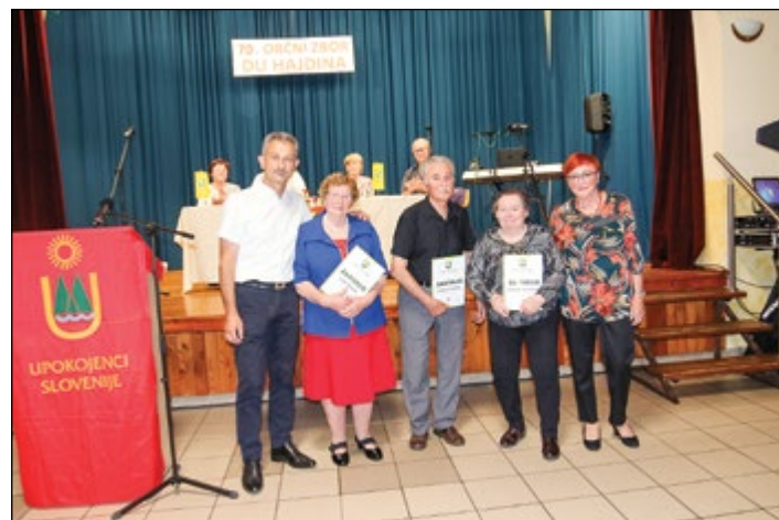
Zahvale za 25 let članstva