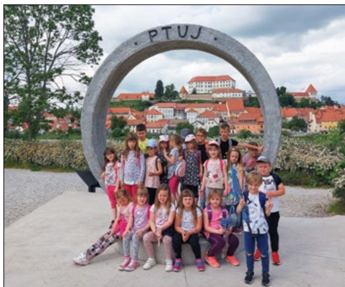
Pred našim lepim gradom