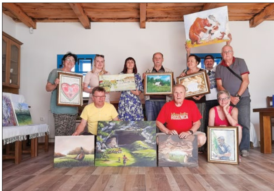
Vsi sodelujoči na likovni koloniji s svojimi deli