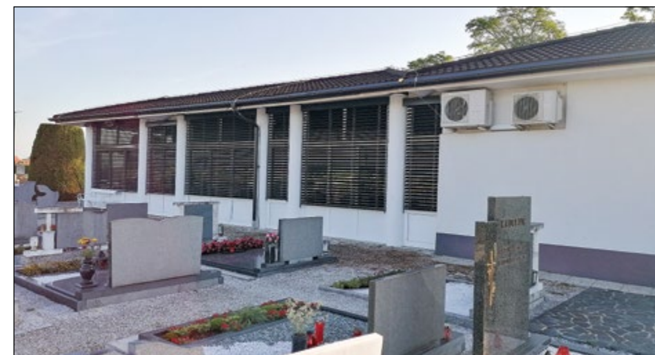
Na mrliški vežici smo namestili nove žaluzije.

Lokalna cesta na Zg. Hajdini, od gasilskega doma proti naselju preko proge, je že dlje časa v zelo slabem stanju. Zdaj je dokončno znano, da bo cesta modernizirana po odprtju obvoznice za Kidričevo.