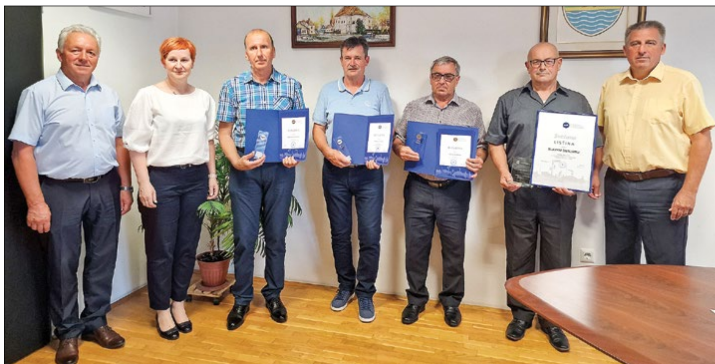
Prejemniki priznanj Agencije za varnost prometa