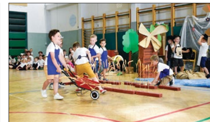
Pestrost Prekmurja so prikazali otroci bele igralnice.