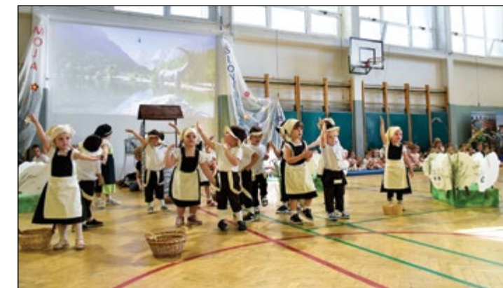
Kekci in Pehte iz modre igralnice