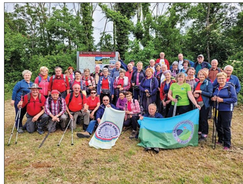
Planinci v kraju Avbelj, kjer smo začeli zadnjo etapo Avbelj–Trst.