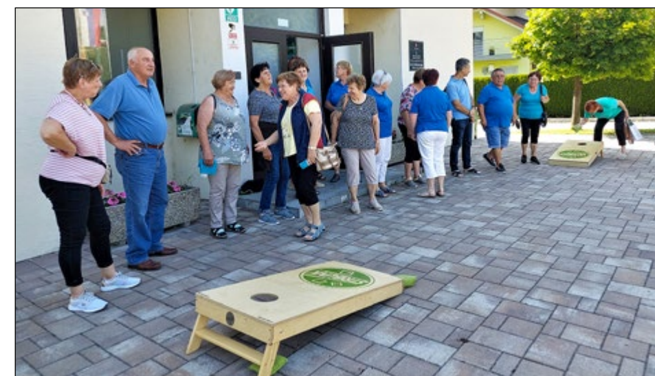
Ali bo Štrbunk postal še ena družabna igra v DU Hajdina?