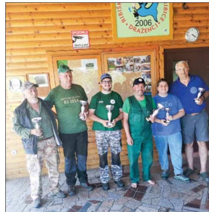
Najboljši ribiški pari, ki so se na tekmovalstvu pomerili konec maja ob draženskem ribniku.