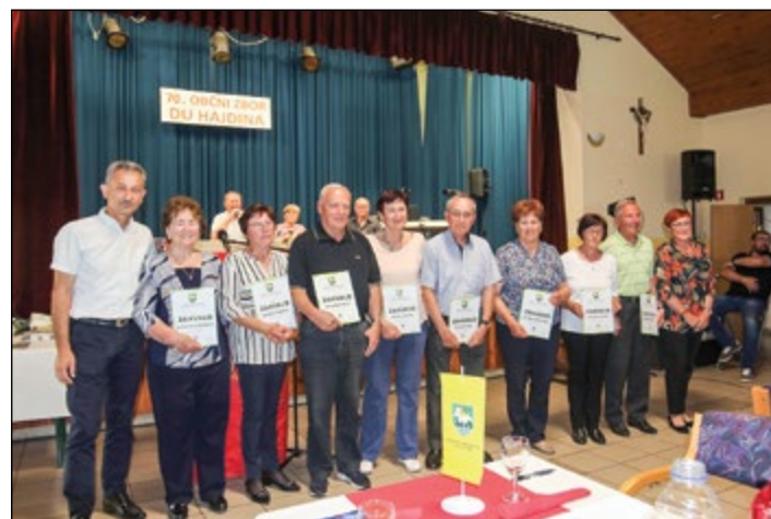
Zahvale za 20 let članstva